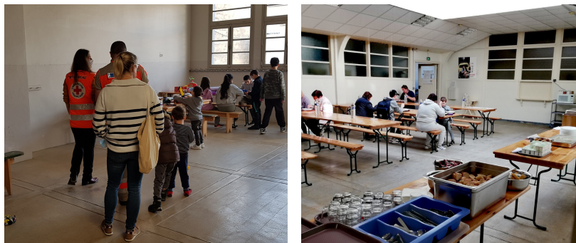
Accueil des déplacés ukrainiens à Sillery le 23 mars 2022